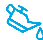
Aceite de caja de transferencia.