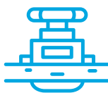
Bomba de vacío.