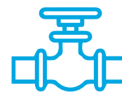
Válvulas y comandos.